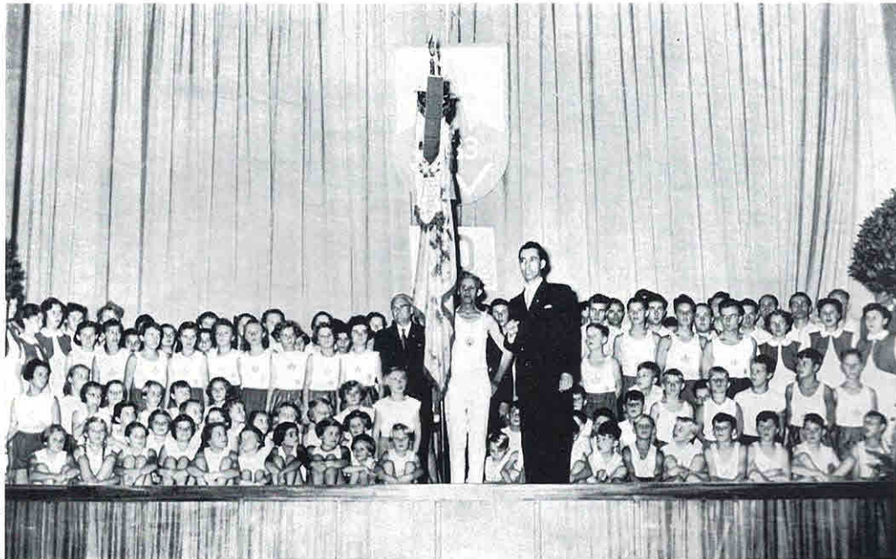
70-jähriges Vereinsjubiläum im Filmpalast