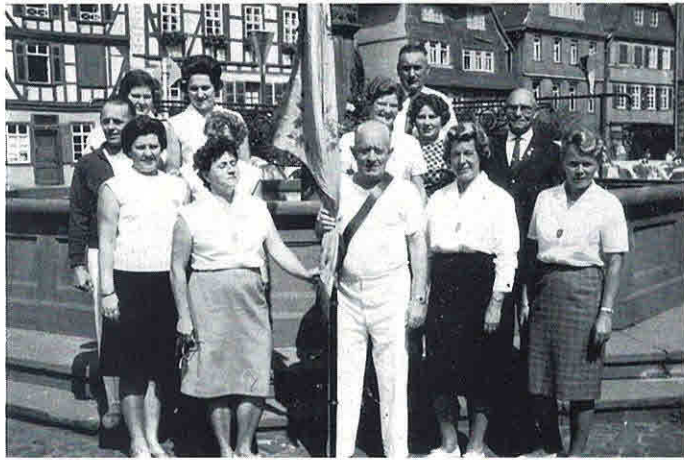
Landestreffen der Altersturner 1964 in Butzbach