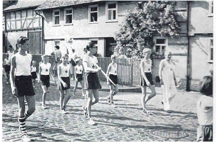
Festumzug 1953 durch Wahlershausen