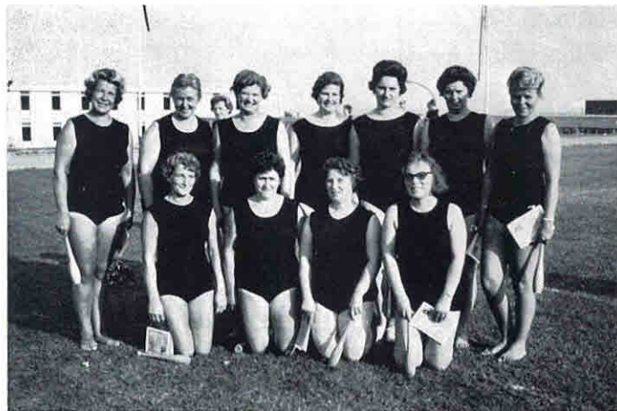
Einige unserer Hausfrauen beim Turnfest 1965 in Elgershausen

Das vertiefte Kennenlernen wird durch Fahrten, Wanderungen und Geselligkeit gepflegt.